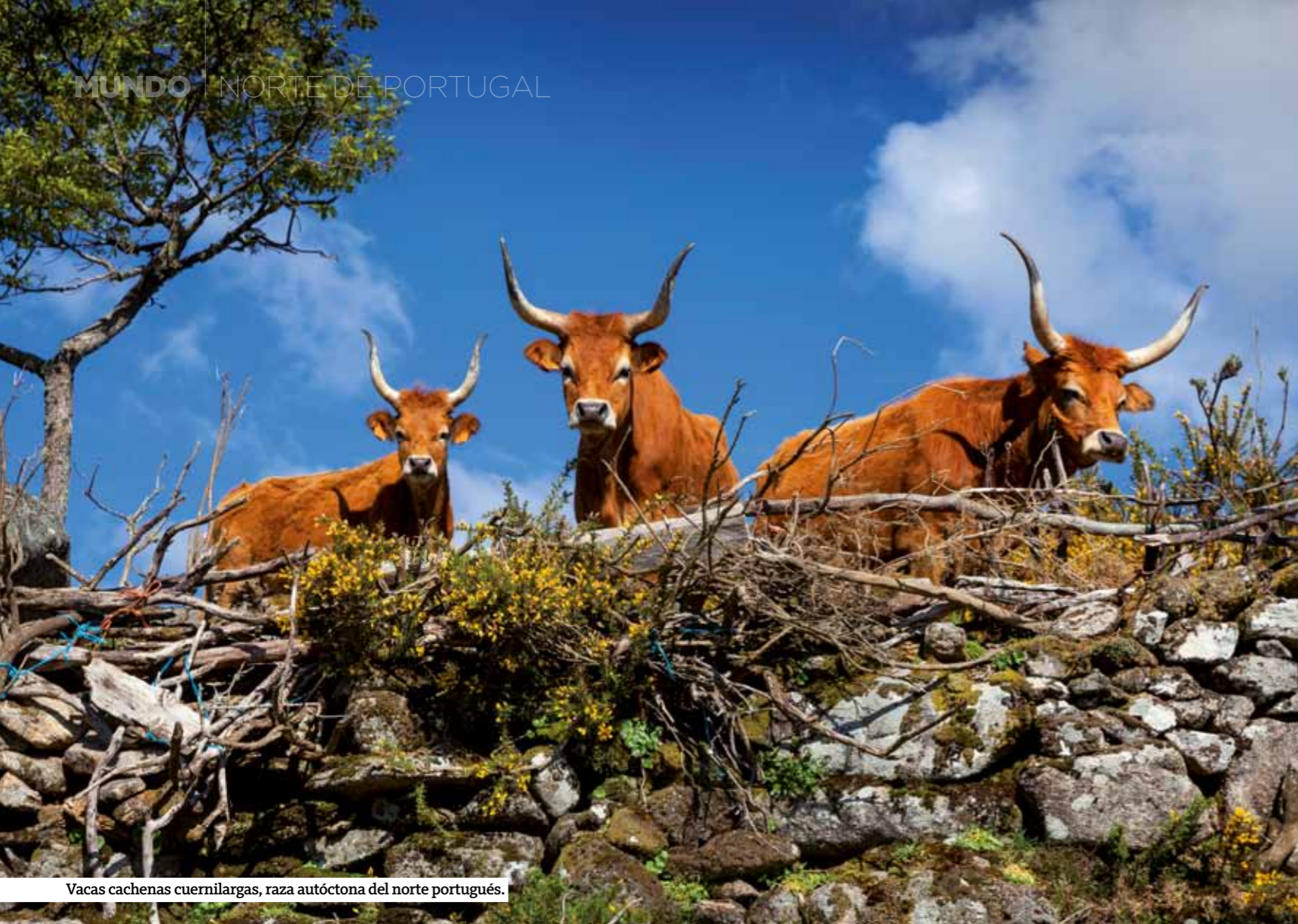
Vacas cachenas cuernilargas, raza autóctona del norte portugués.