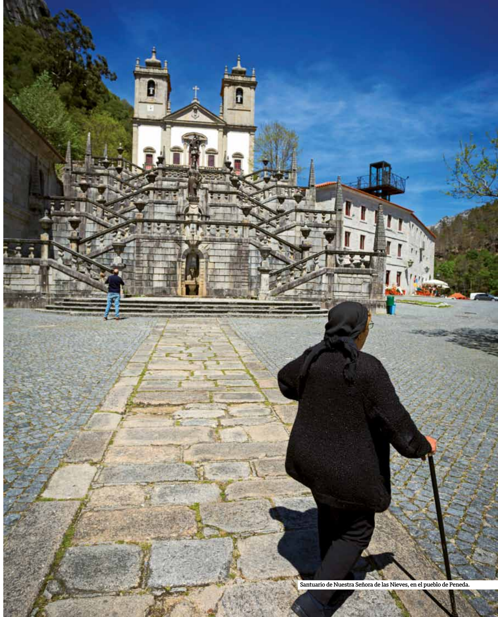
Santuario de Nuestra Señora de las Nieves, en el pueblo de Peneda.

Al abandonar Braga en dirección norte, la ruta atraviesa Ponte de Lima, la ciudad más antigua de Portugal y punto clave en la ruta de peregrinación a Santiago de Compostela, y a continuación se llega a Arcos de Valdevez. Es este un bonito pueblo que alcanzó fama por su amplia