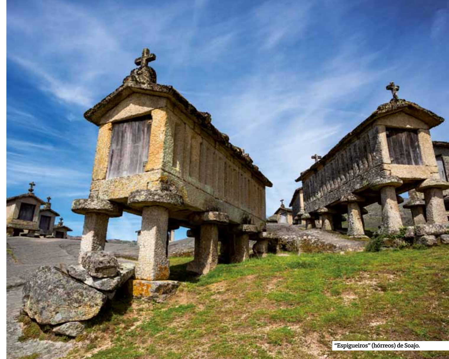
"Espigueiros" (hórreos) de Soajo.

población de nutrias y sus siete iglesias. Ahora su actividad turística se centra en la explotación de una ecovía a orillas del río Vez. La vía transcurre hasta Sistelo a lo largo de 12 km por pasarelas de madera que hacen pensar al viajero en algunos tramos que camina casi flotando sobre las limpias aguas de este río truchero. Si le gusta el piragüismo, apunte este lugar. La excursión en kayak proporciona emociones y rincones encantadores como el puente medieval de Vilela.