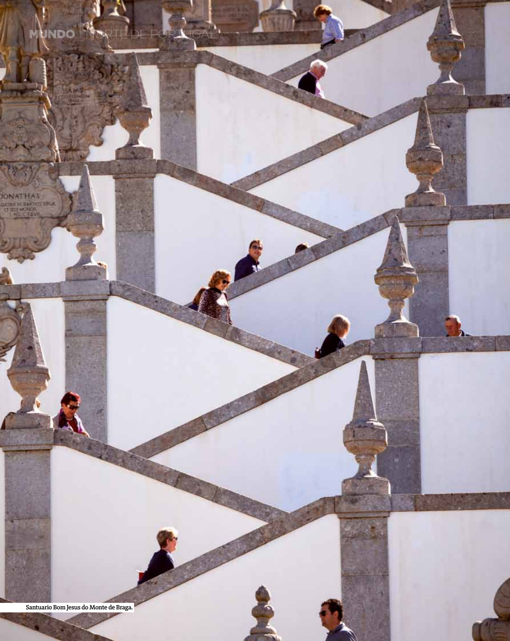
Santuario Bom Jesus do Monte de Braga.