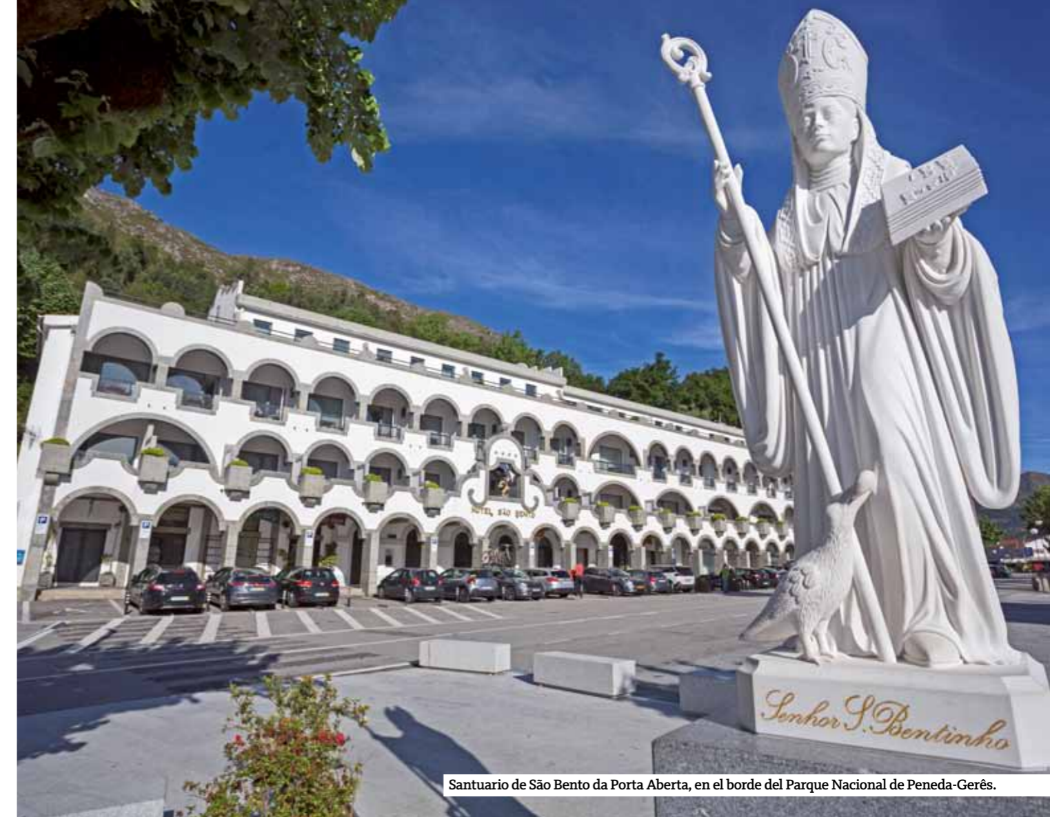
Santuario de São Bento da Porta Aberta, en el borde del Parque Nacional de Peneda-Gerês.

por la comunidad para almacenar y secar el abundante maíz de la región. En su parte superior destacan las cruces de estos alargados bloques graníticos que representaban la protección divina de la comida, el alimento de una comunidad de casas bajas y cerradas, empleadas para protegerse especialmente de los crudos inviernos de la sierra.