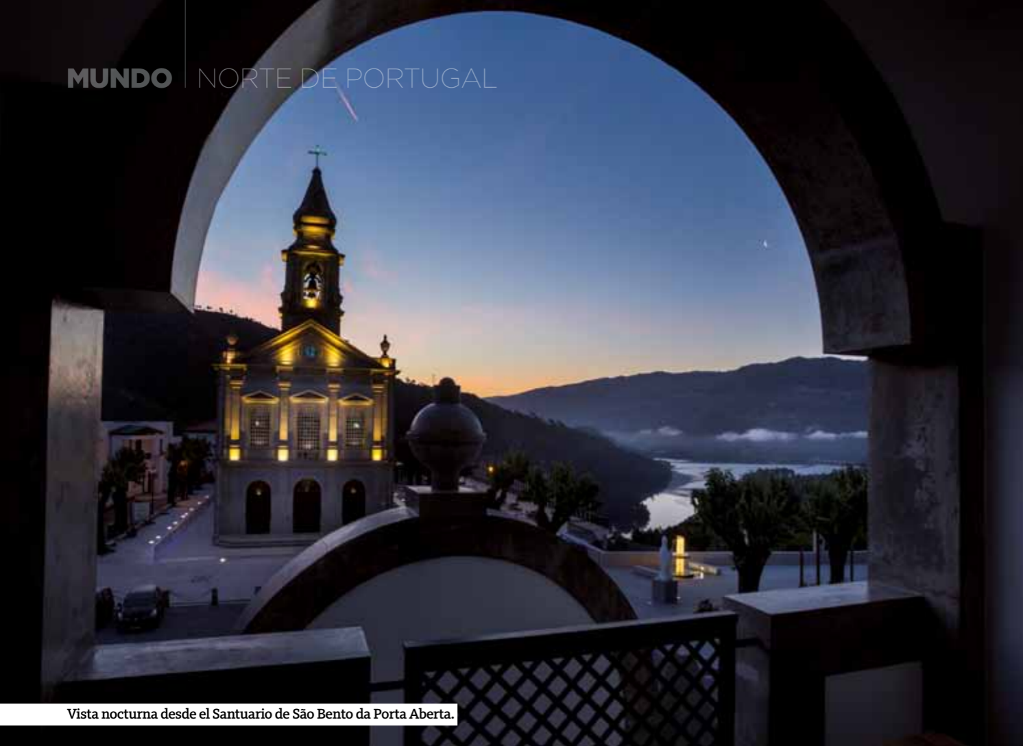
Vista nocturna desde el Santuario de São Bento da Porta Aberta.

área: mujeres vestidos de negro, bien por su condición de viudas o por tener al marido emigrante trabajando en otros países, trabajan en el campo llevando en sus cabezas, de manera admirable, coube y otras verduras para la alimentación de cerdos y gallinas. Solo hay dos bares en el pueblo, pero uno de ellos, la Taberna Terra Celta, con Margarida Paiva al frente, merece una visita para tomar un vinho verde y una tapa de embutido en su salón-museo de la primera planta. Fuera del pueblo no se puede dejar de visitar las ruinas del monasterio de Santa María de Junias, oculto junto al río Campesino, o su cascada hermosa a la que se accede por una prolongada pasarela de madera