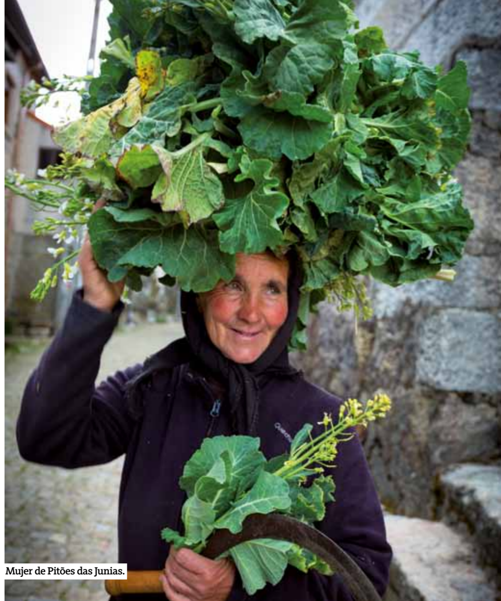
Mujer de Pitões das Júnias.