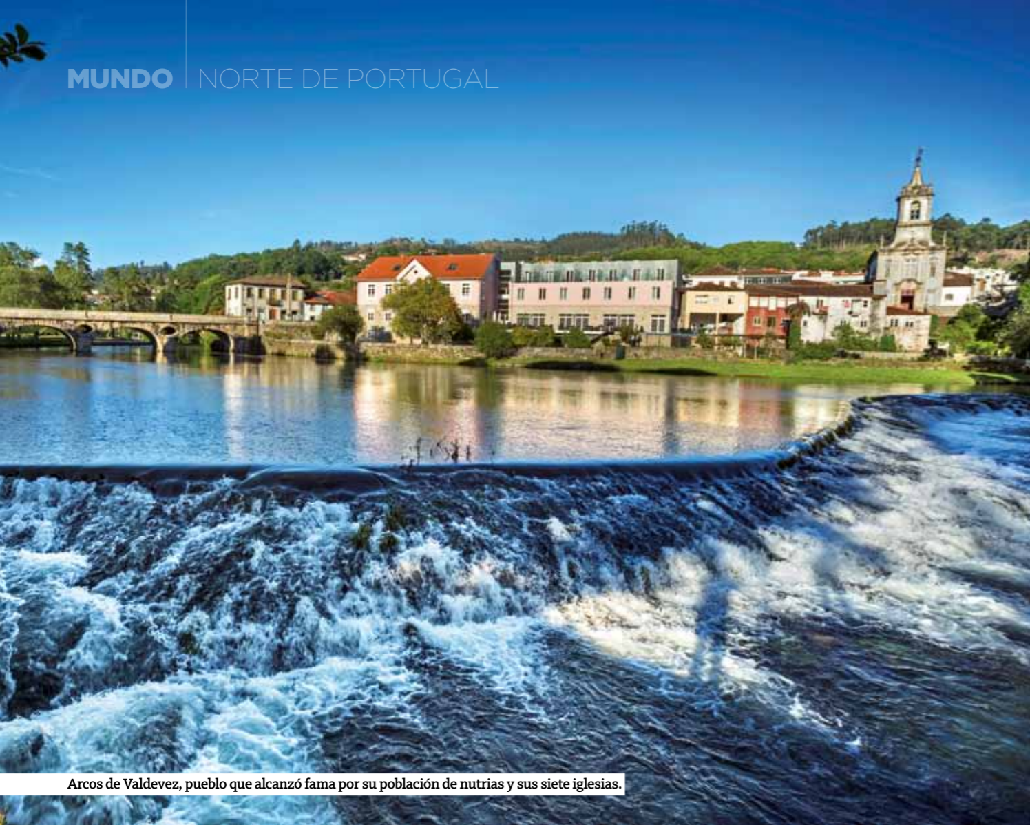
Arcos de Valdevez, pueblo que alcanzó fama por su población de nutrias y sus siete iglesias.

N o se equivocará si viaja al norte de Portugal y le gusta la Naturaleza con mayúsculas. Esta región montañosa colindante con Galicia, con la que tanto comparte tradiciones y costumbres, alberga un área con cotas de montaña entre 700 y 1.545 metros, donde mandan el corzo y el lobo ibérico, especie que mantiene una población estable después de siglos de pugna con los habitantes de esta región de gran riqueza geológica pero algo desolada en muchos lugares, hoy, eso sí, abiertos al turismo. El buque insignia incuestionable de la región es el Parque Nacional da Peneda-Gerês, el único oficial en tierras lusas, creado en el año 1971 entre las Serras da Peneda, do Soajo, de Amarela y do Gerês. Un territorio repleto de cascadas, miradores, monasterios,