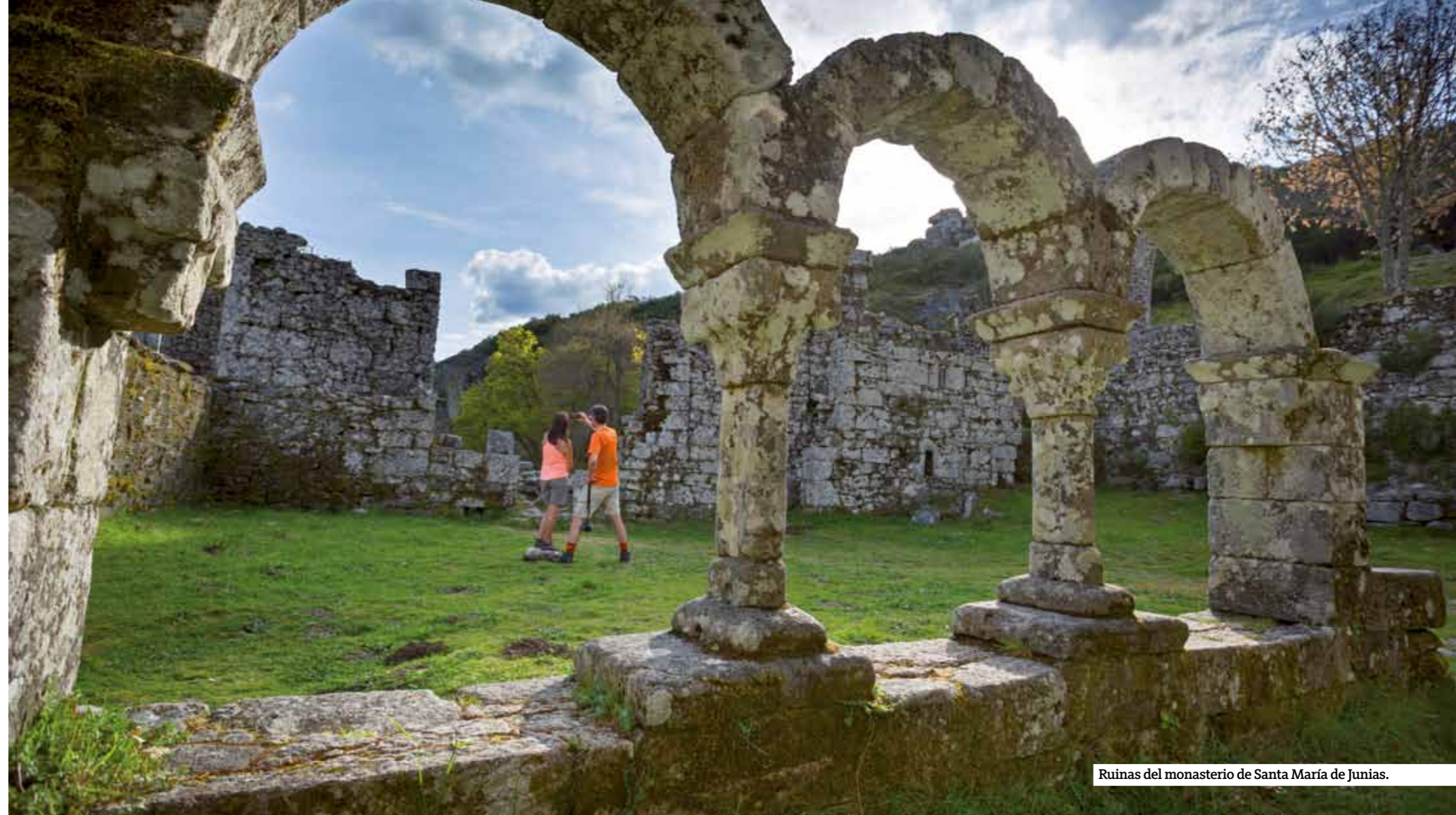
Ruinas del monasterio de Santa María de Júnias.

junto a una lapa donde apareció la imagen de una Virgen, y hoy se accede a él a través de una escalinata monumental con veinte pequeñas capillas que narran episodios de la vida de Jesús. Todos los años, en la primera semana de septiembre numerosos peregrinos, procedentes de toda la región y de Galicia, acuden a este lugar para venerar a la Virgen en un edificio de 300 metros de altura que se alza de manera prodigiosa en medio de la naturaleza.